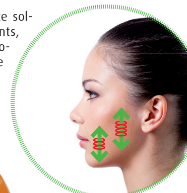
1 er équilibreur de mâchoires

Elle permet donc une parfaite sollicitation proprioceptive (dents, ligaments, muscles,..), favorise un travail musculaire équilibré et procure ainsi au patient, une extrême détente des articulations temporo-mandibulaires (mâchoires).